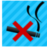
Quit It Lite - stop smoking now