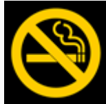
LIVESTRONG MyQuit Coach - Dare to Quit ...